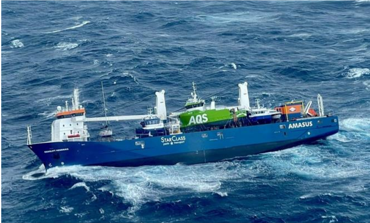
Emslift Hendrika kom i drift i Nordsjøen vest av Stadt 5. april 2021